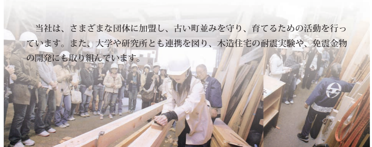
↑ 大学建築科の学生を招いて、大工工事の解説をしています。学校からのインターンシップもたくさん受け入れています。

当社は、さまざまな団体に加盟し、古い町並みを守り、育てるための活動を行っています。また、大学や研究所とも連携を図り、木造住宅の耐震実験や、免震金物の開発にも取り組んでいます。