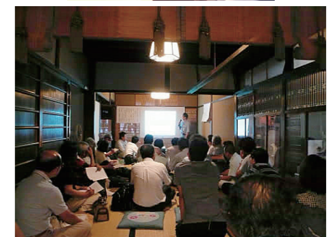
さまざまなセミナーを開催し、京町家の手入れ ↑ の仕方や、傷みの見分け方などを伝えている。