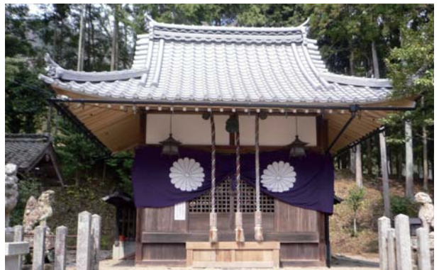
↑ 牧一ノ宮神社 (福知山市)