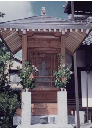
観興寺鐘楼 (福知山市) ↓

当社では、自社で培った技術を活かし、地元の庶民的な社寺の小さな改修から大規模な修繕に携わってきました。氏子さんや檀家さんから集めた浄財を有効に活用いただくためにも、是非ご検討ください。