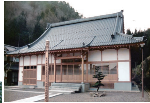
↑ 泉谷寺 (京丹波町)