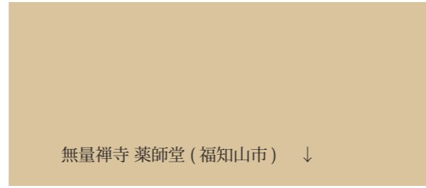
無量禅寺 薬師堂 (福知山市) ↓