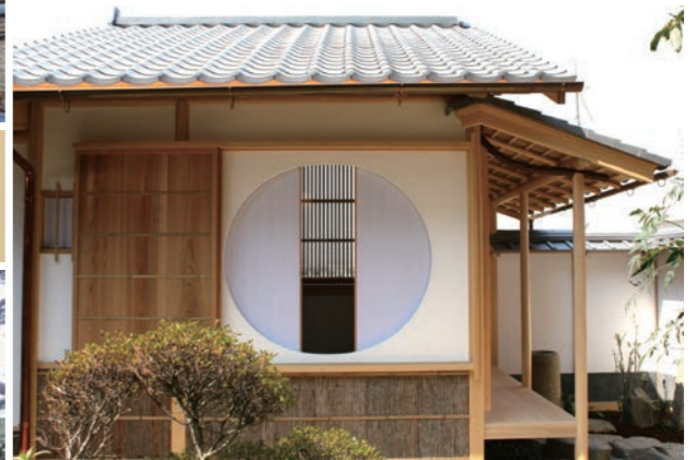
↑ 茶室 (八幡市)