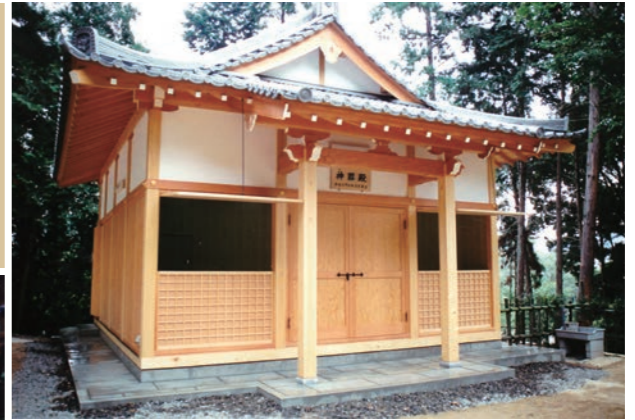
↑ 勧修寺八幡宮 神器殿 (山科区)