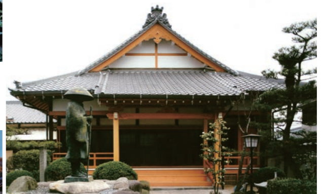
↑ 阿弥陀寺 (摂津市)