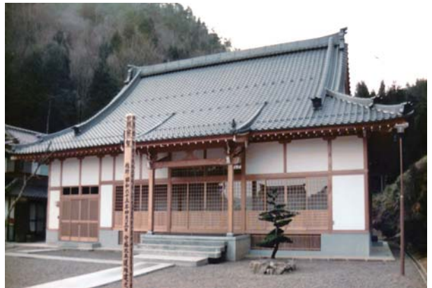
↑ 泉谷寺 (京丹波町)