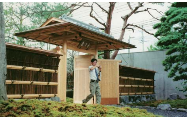
← 霞中庵中門 (右京区)