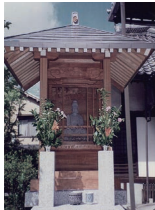
観興寺鐘楼 (福知山市) ↓

当社では、自社で培った技術を活かし、地元の庶民的な社寺の小さな改修から大規模な修繕に携わってきました。氏子さんや檀家さんから集めた浄財を有効に活用いただくためにも、是非ご検討ください。