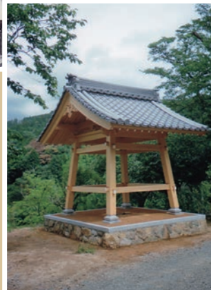
栄春寺 (福知山市) ↑