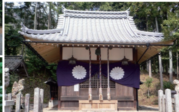
↑ 牧一ノ宮神社 (福知山市)