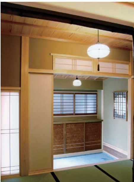
↑ 玄関：純和風。三方から灯りが差し込む。