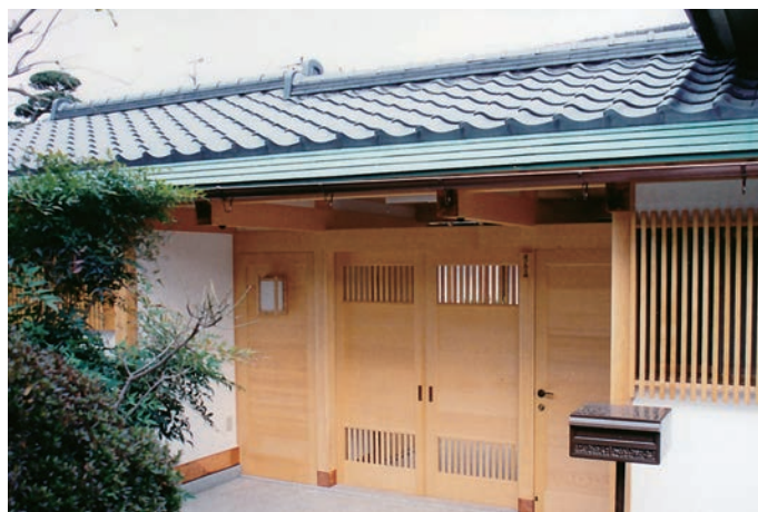
外観：町並に合わせ落ち着いた雰囲気。 ↓