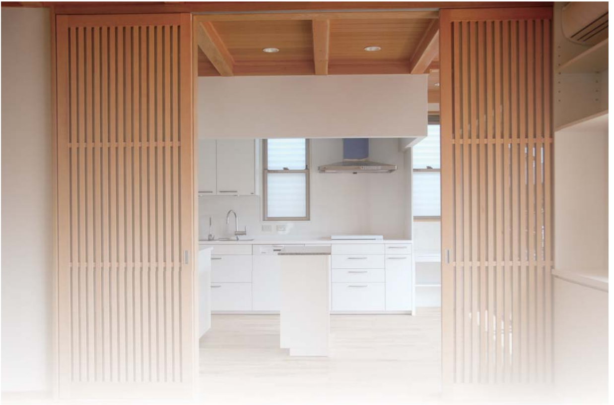
台所：建具を全開するとリビングと一体化。 ↑