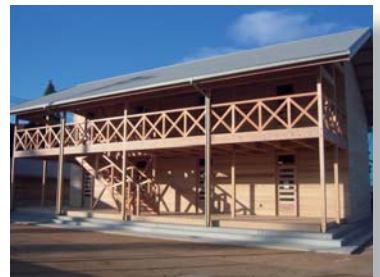
木造クラブハウス