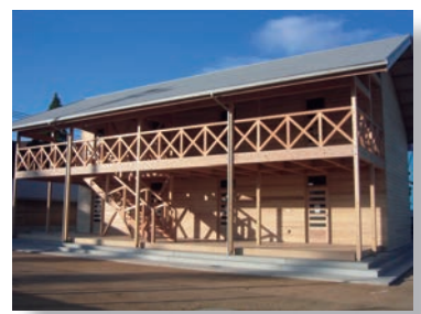
木造クラブハウス