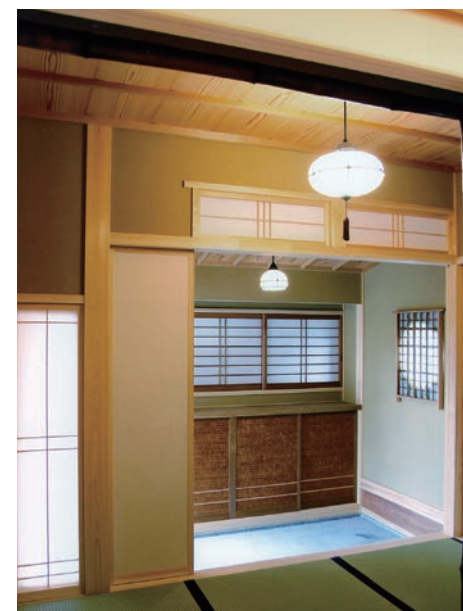
↑ 玄関：純和風。三方から灯りが差し込む。