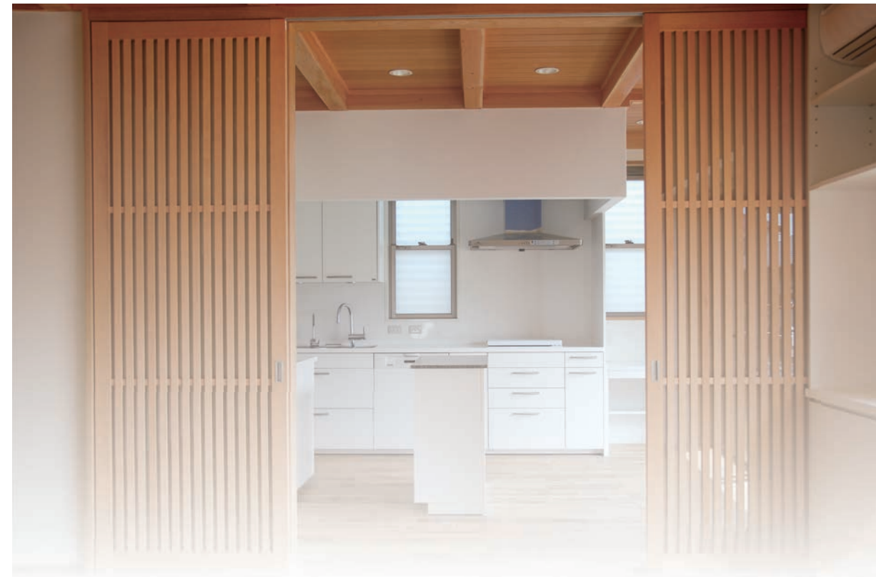
台所：建具を全開するとリビングと一体化。 ↑