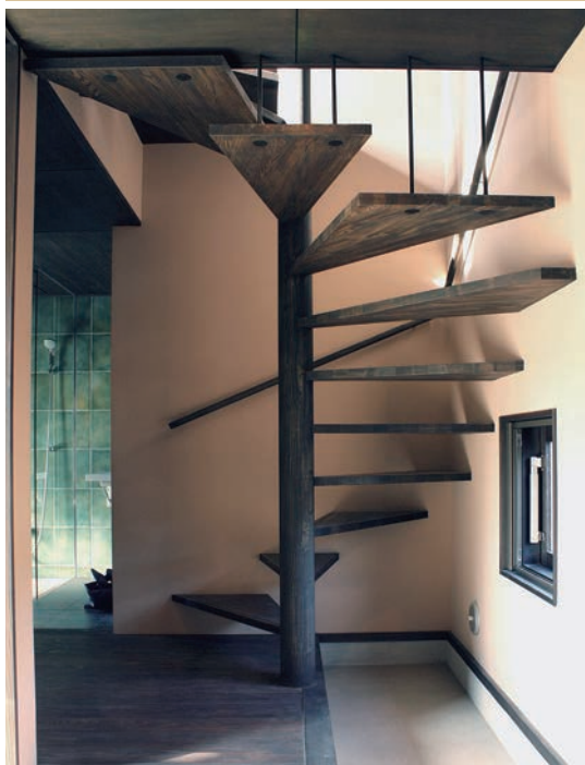
↑ 階段：余分な材を見せないシンプルなつくり。