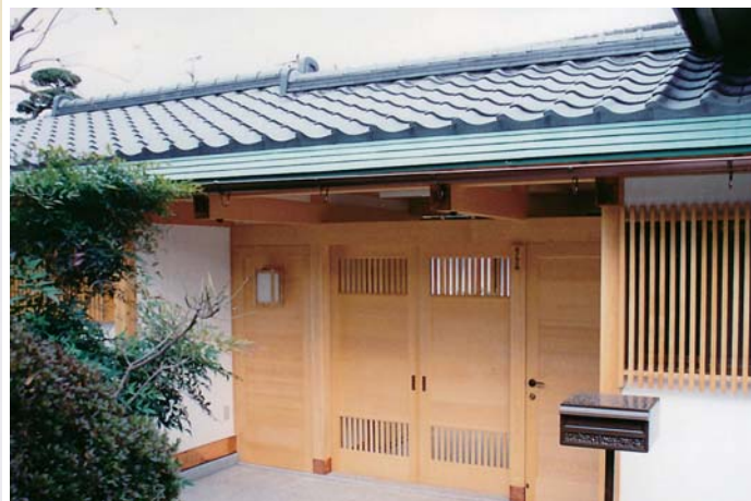
外観：町並に合わせ落ち着いた雰囲気。 ↓