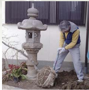
↓ 小川珈琲 (右京区)