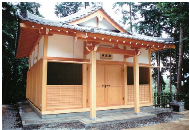
↑ 勤修寺八幡宮 神器殿 (山科区)