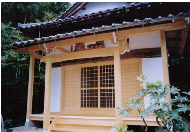
無量禪寺 薬師堂 (福知山市) ↓