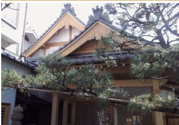
法輪寺 (下京区) ↓