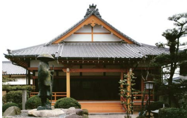
↑ 阿弥陀寺 (摂津市)