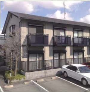
S造 RC造、学生アパート の新築も…。