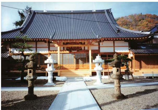
永明寺 (福知山市) ↓