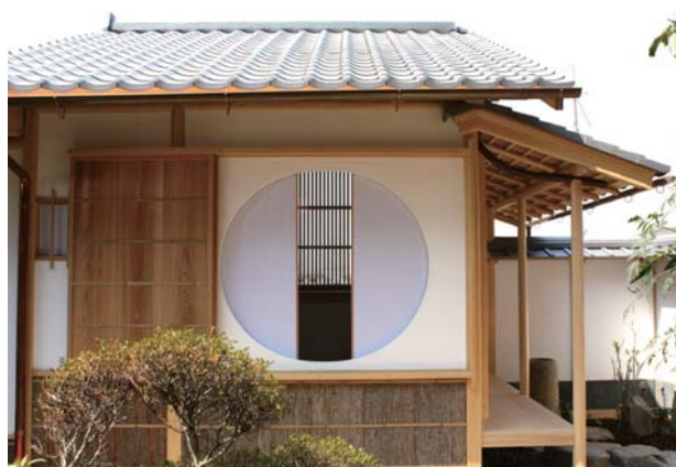
↑ 茶室 (八幡市)